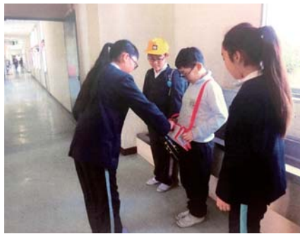
[ たかむち小学校より募金 ]