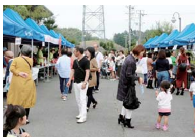
【模擬店・うまいもんコーナー】