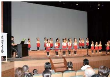
【スマイル/育成幼稚園】