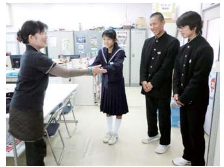
[ 高取中学校より募金 ]