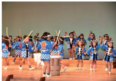
【樽太鼓演奏/高取幼稚園】

平成29年9月24日(日)、高取町リベルテホールにて『たかとり元気フェスタ』を開催しました。 今回は、600名を超える方々にご来場いただき、誠にありがとうございました！ 今後もボランティア一同、力を合わせて、高取が“元気な町”でありますよう取り組んで参ります！