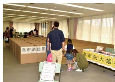
【ダンボール迷路/高市消防署】